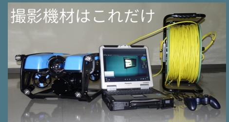
撮影機材はこれだけ

水中ドローンオペレーターも必然的に ダイバーです。ダイバーならではの 視点で操作的確に撮影することが できるでしょう。